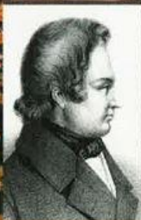
Ci-contre et ci-dessous : Victor Hugo et son fils Victor (8 ans), peints par Auguste de Châtillon, en 1836 ; édition originale de Notre-Dame de Paris (1831) ; Sainte-Beuve, le « meilleur ami » de la famille, vers 1830 ; Léopoldine Hugo à 18 ans, dessinée par Dubufe au moment de son mariage, quelques mois avant sa mort accidentelle en 1843.